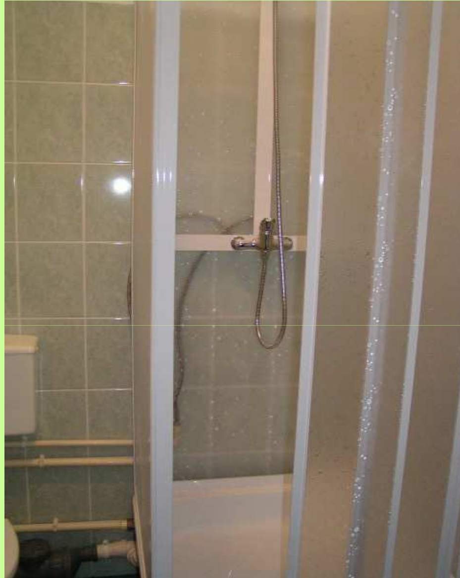
Łazienka (kabina prysznicowa)