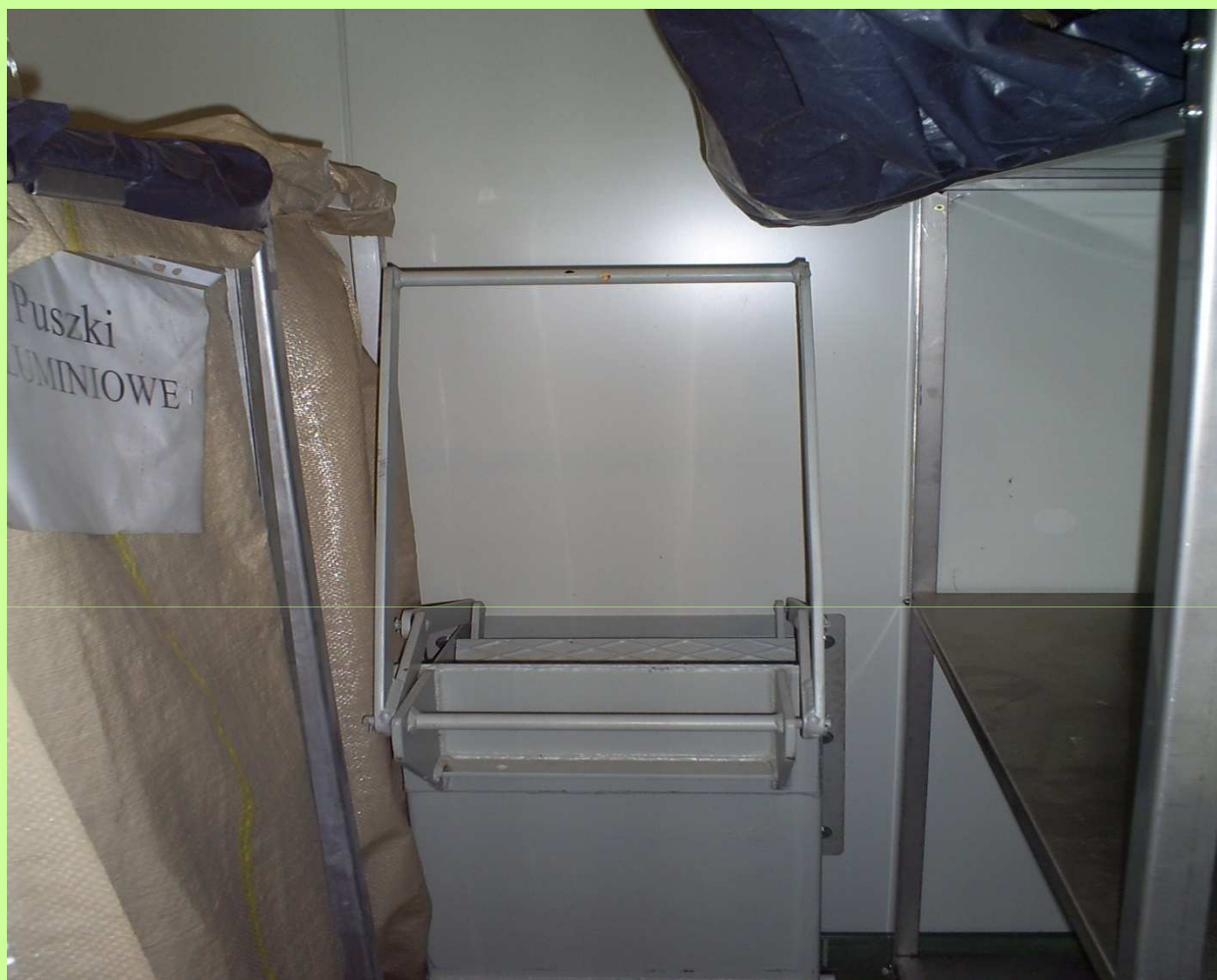
Ręczna zgniatarka do opakowań metalowych i z tworzyw sztucznych