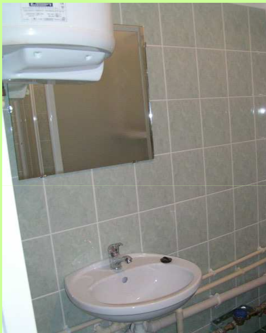
Łazienka (podgrzewacz wody, umywalka, toaleta).